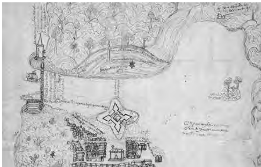
Figura 2. La Habana y el pueblo de indios de Guanabacoa. Mapa con fecha probable de 1567. Archivo General de Indias (MP-SANTO_DOMINGO, 4). Obsérvese en el extremo superior derecho el dibujo esquemático del pueblo de indios.

1984; Valcárcel Rojas, 1997). Esta situación sugiere que tales pueblos de indios –relacionados con asentamientos hispanos– pudieron ser más numerosos y muchos aún desconocidos.