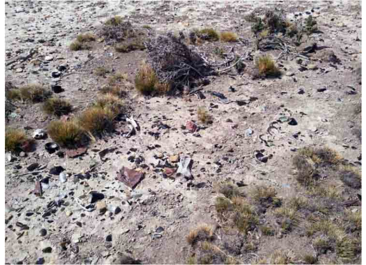
FIG. 36. Detalle de la alta concentración de restos materiales en el sitio El Arenal 1

mínimo de individuos, NMI) calculando las bases y picos. Cabe destacar que la mayoría de vidrios son negros y de tradición inglesa, para vinos y licores, casi no habiendo ginebras cuadradas. Otro elemento curioso resultó ser la marcada cantidad de botellas de sidra con la marca ( N ) V. B. y F. provenientes de Villaviciosa, en Asturias, España, primera vez que las encontramos en el país. Estas están junto a varias bases de H. Heye Glassworks de Hamburgo, fábrica que funcionara entre 1880 y 1890, y otras con una N en la base, posiblemente de la fábrica Obear-Nester Glass Company , de East Saint Louis, Illinois, Estados Unidos, que comenzó a trabajar en 1894, mostrando que la variedad temporal del material dentro de la misma categoría no es poca. Hay muchos picos de amargos tipo bitter e incluso vino Chianti. Pero la marca N nos