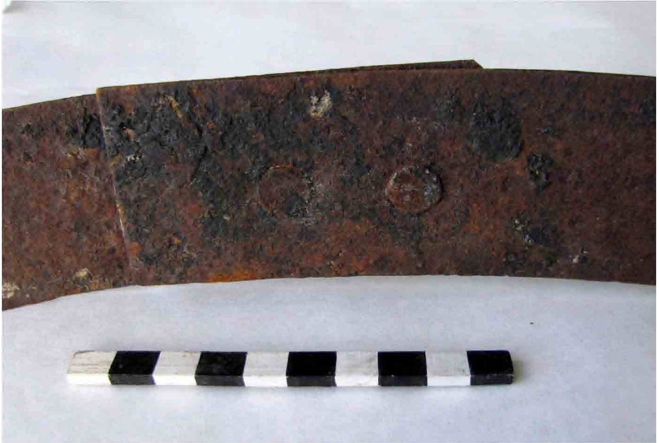
FIG. 88. Fleje cerrado con dos cabezas de clavos redondos de producción industrial que aun conservan las marcas de su manufactura; nótese que los cortes finales son oblicuos