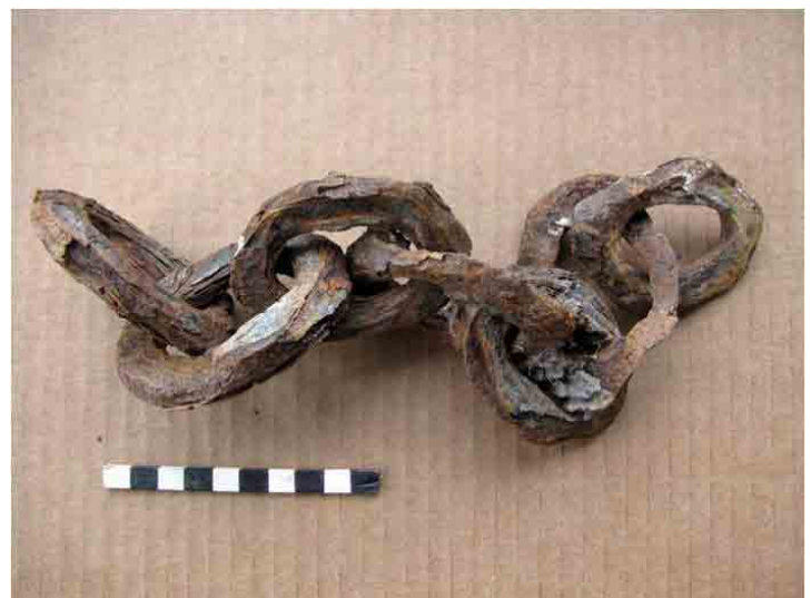
FIG. 62. Antigua cadena de uso náutico proveniente de la barranca de la costa, con eslabones forjados