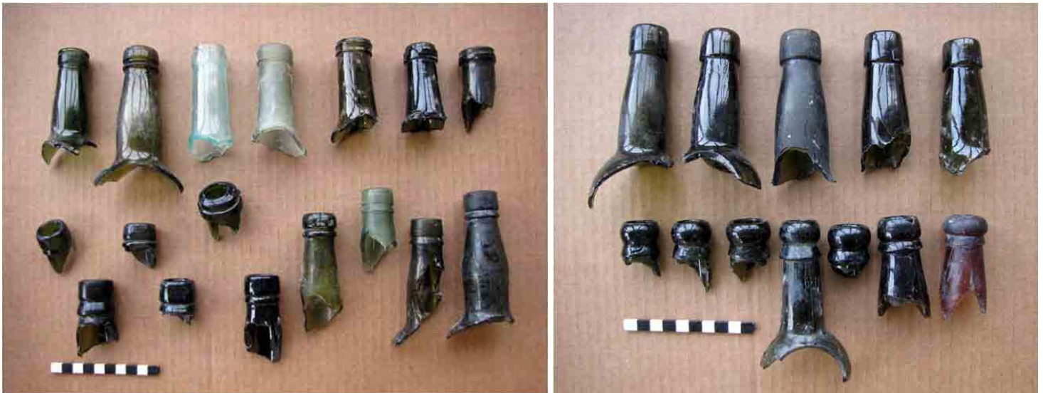
FIG. 54 y 55. Diversos tipos de picos de botellas de licor, vino y cerveza que muestran ejemplos desde 1860 hasta 1920; nótese los inferiores de la derecha, posiblemente de sidra, redondeados para tomar de la botella