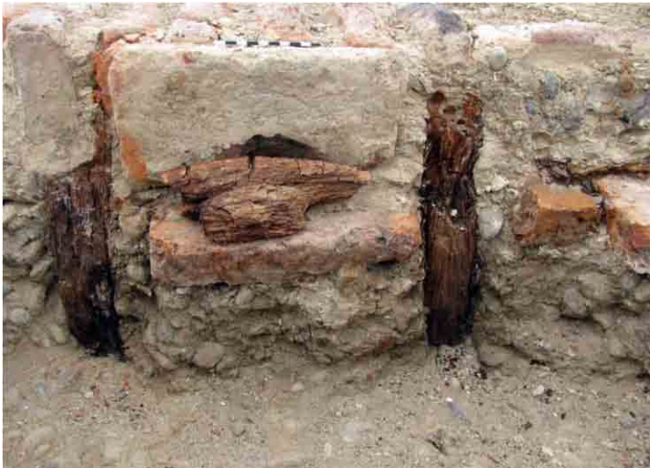
FIG. 21. Vista interior de la estructura con el peculiar sistema de ladrillos de canto y vigas y columnas de madera

que se ven a simple vista, ubicadas de manera extendida sobre la que fuera la terraza principal. Esta, es evidente, tenía una extensión de cerca de veinte metros de largo pero que al trazarse el camino fue cortada por la maquinaria, produciendo el derrumbe de multitud de ladrillos y materiales arqueológicos diversos. Este sector es el que asociamos por sus dimensiones y ubicación con la fábrica que estableció Ernesto Rouquaud a “unos 100 metros de la playa”. Las pequeñas estructuras cercanas que se describen por separado deben ser las asociadas a ese emprendimiento. Las fotos son claras al indicar que existió al menos un gran piso de ladrillos horizontales, que se ha ido derrumbando, rompiendo, y luego desintegrando al llegar al pie de la pequeña barranca, de un metro aproximado, que hizo la maquinaria vial. Por otra parte también se observa que hacia el cerro, los derrumbes han cubierto otro sector, que podría despejarse y quizás haya una pequeña parte en buen estado bajo el enorme sedimento que lo cubre.