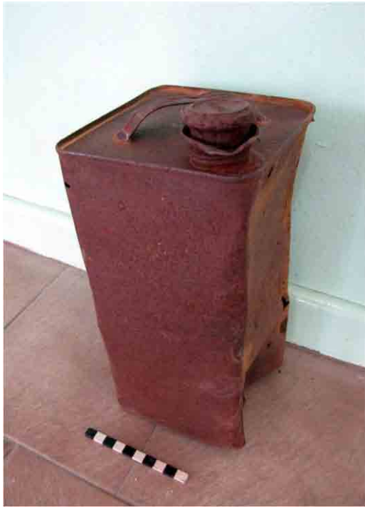
FIG. 63. Lata de aceite automotor, siglo XX