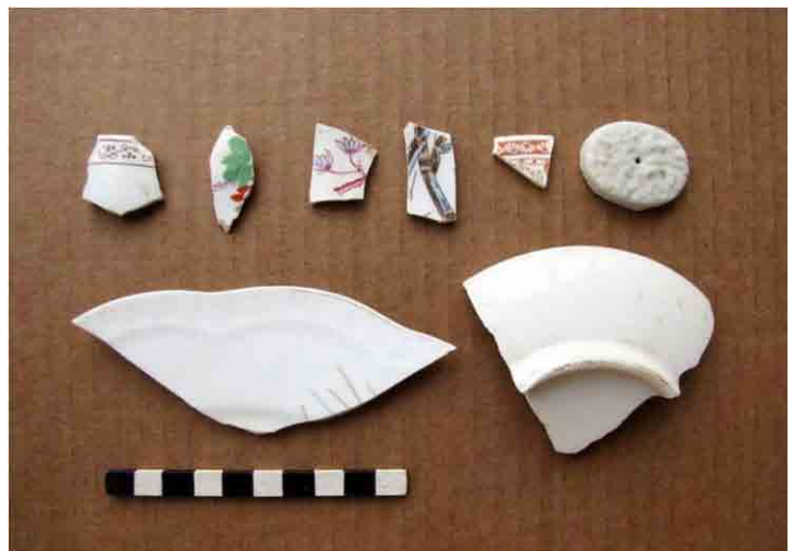
FIG. 50. Diversos fragmentos de porcelana europea, varios pintados sobre la cubierta