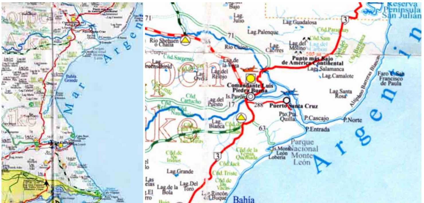
FIG. 1. Ubicación de Puerto Santa Cruz y del Cañadón Misioneros