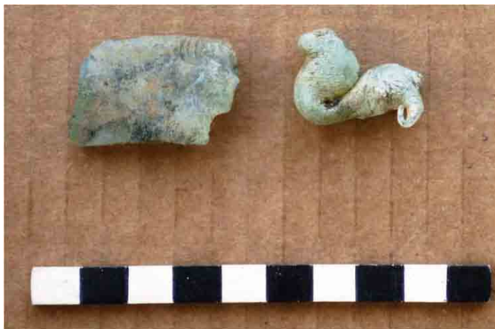
FIG. 30. Vidrio fundido