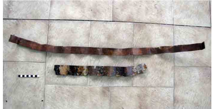
FIG. 94. Láminas alargadas con la forma de las chapas acanaladas de zinc usadas en techos para ayudar a sostenerlos ante el viento

Su función concreta era servir de tensores o soportes para evitar que vuelen los techos de chapas, aunque clavados, todos sabemos que aun hoy los fuertes vientos tienden a levantarlas; más aún en Patagonia. Éstos terminan en sus extremos en un doblez simple al que se ataban alambres, o grupos de ellos enroscados, que a su vez se ataban a estacas de hierro clavadas al suelo. En este caso y gracias a la excelente preservación en el sitio hemos encontrado varios atados de alambres, por lo general de más de un metro de largo y entre dos y ocho de ellos, enroscados entre sí. Incluso se encontró una estaca clavada en el suelo, forjada, de hierro. Si se observan las fotografías de época, se puede notar, aunque con dificultad, que las construcciones tienen efectivamente amarres al suelo.