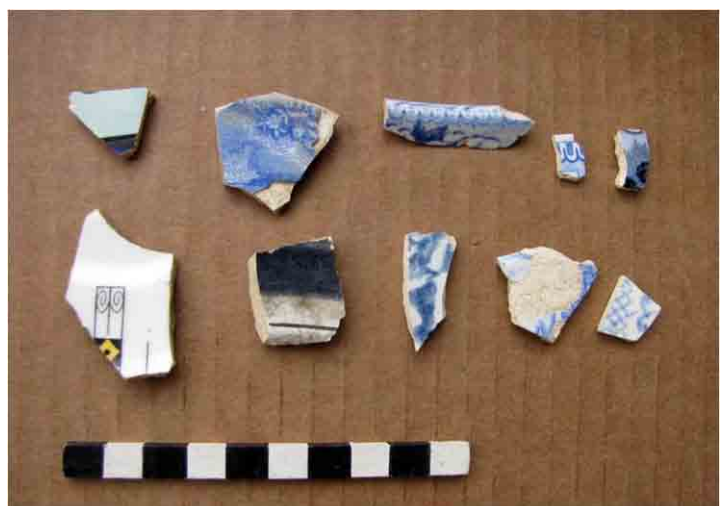
FIG. 51. Lozas inglesas Whiteware, decoradas, siglo XIX e inicios del XX