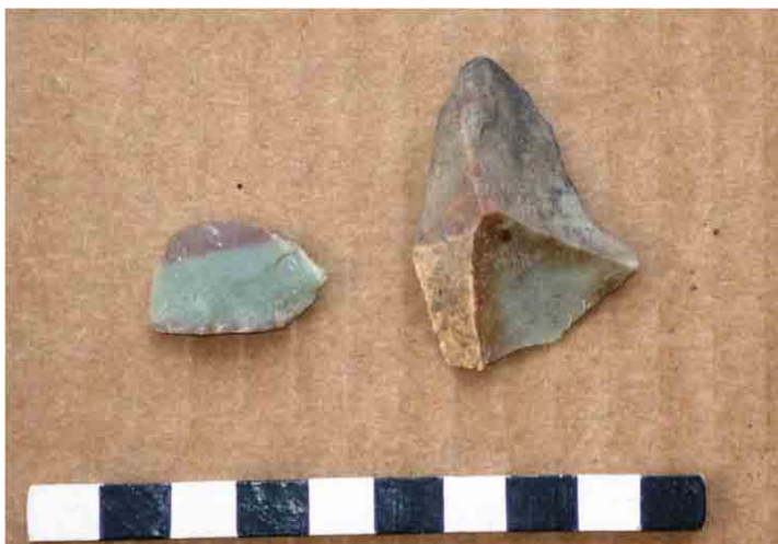
FIG. 34. Lascas primarias de piedra