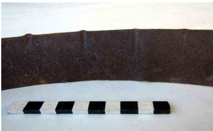
FIG. 84. Fleje cortado en maquinaria pero trabajado de un lado mediante golpes, para darle la curvatura alabeada del barril