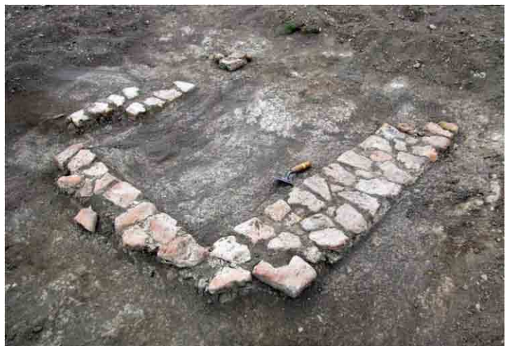
FIG. 26. Estructura 3, con sus tres muros remanentes aunque sin piso, el desagüe anual pasa por encima de forma oblicua

los Rouquaud. Esta estructura está sobre una lomada, claramente al viento y lo que se ve es una acumulación de ladrillos rotos sin forma; tras su limpieza, se encontraron los restos de tres hiladas de ladrillos, colocados horizontalmente, orientadas de norte a sur, posiblemente un piso, midiendo 0,50 por 0,72 metros. Los ladrillos miden, como casi todos los del cañadón, entre 14 y 15cm de ancho, entre 4 y 5 de alto y el largo máximo determinado es de 23cm. Es evidente que se usaron ladrillos rotos previamente, como en otros sitios, sea producto de la mala cochura local o de reuso. En su entorno se ubicaron 48 fragmentos más de ladrillos arrastrados por la lluvia, lo que es evidente por la torrentera que lo cruza.