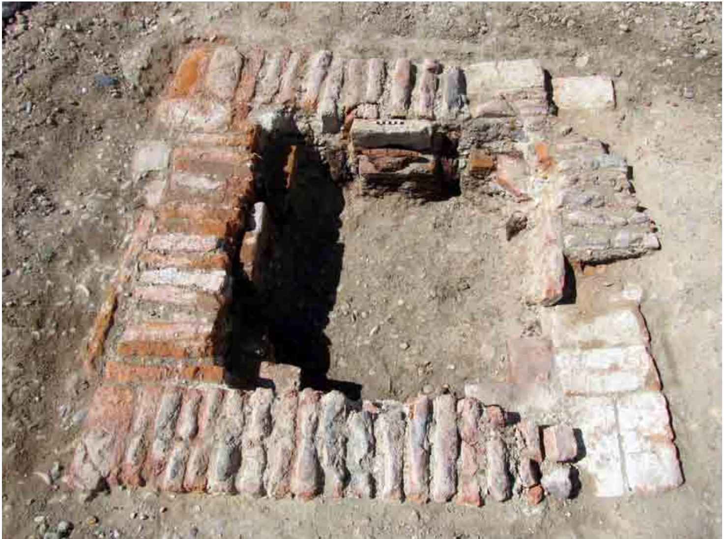
FIG. 20. Estructura 1 excavada, nótese que restan la hilada superior de ladrillos de canto sobre otra colocada horizontal. En los bordes internos quedan restos de columnas de madera y ladrillos sosteniendo vigas

Donde se encuentra el monumento y las construcciones a la derecha del camino, justo bajo el cerro, en pleno Lugar Histórico, hay varias concentraciones de ladrillos