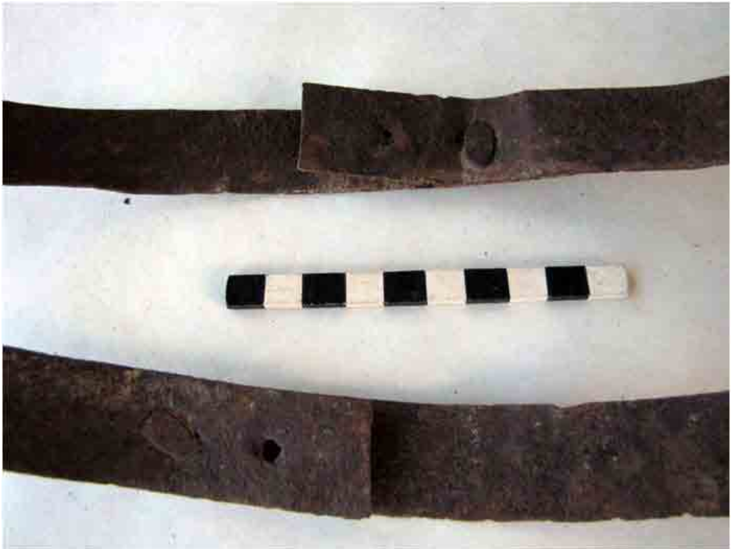
FIG. 90. Arreglos de sunchos mediante forjados simples en flejes de máquina de diferente ancho