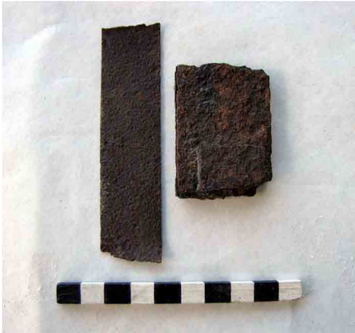
FIG. 82. Dos fragmentos de sunchos de barril del siglo XIX con marcas de forjado