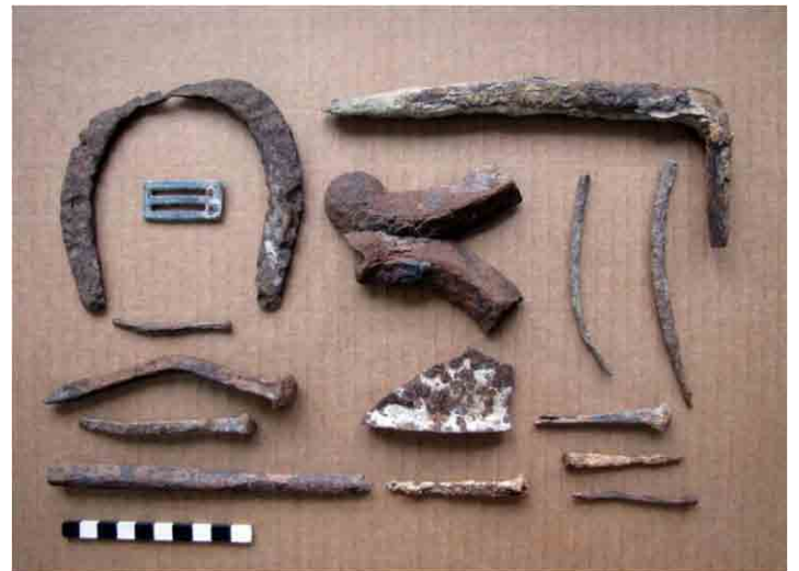
FIG. 61. Objetos de hierro diversos: una herradura, clavos de perfil cuadrado, una estaca forjada, un fragmento de olla y un objeto ornamental, parte de la vida cotidiana del siglo XIX