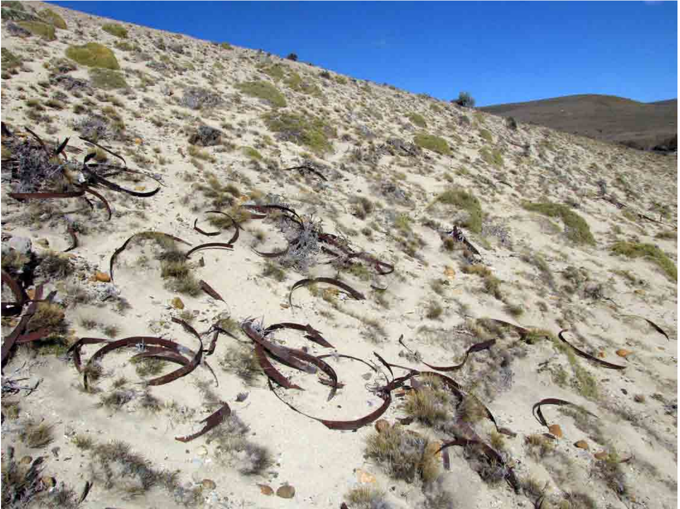
FIG. 17. Concentración de aros de barril en la parte posterior del Lugar Histórico