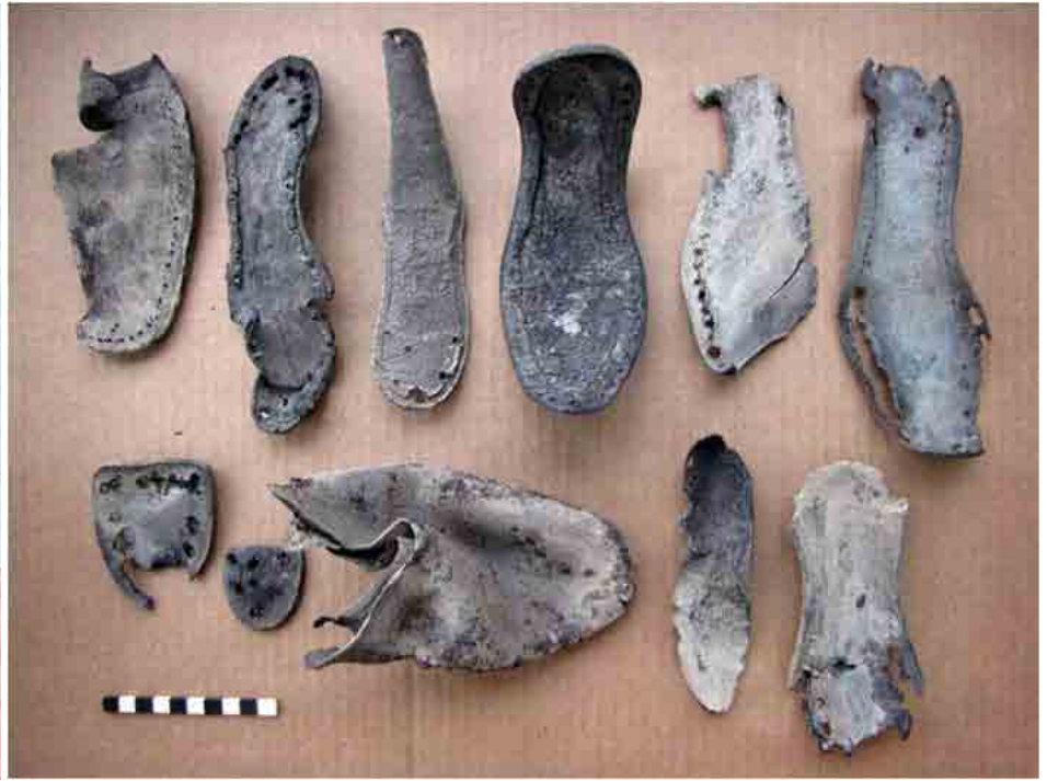
FIG. 64. Suelas, tacos y cabezadas de botas de cuero con las marcas de las formas de cosido manual, mecánico, con alambre y con clavos

conocimiento y para otros campos de especialización.