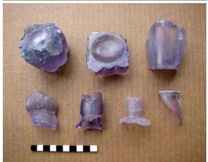
FIG. 11. Vidrio transparente que ha adquirido tono violeta, posiblemente por efecto de la luz ultravioleta de la intemperie, tema sólo observado en la Patagonia