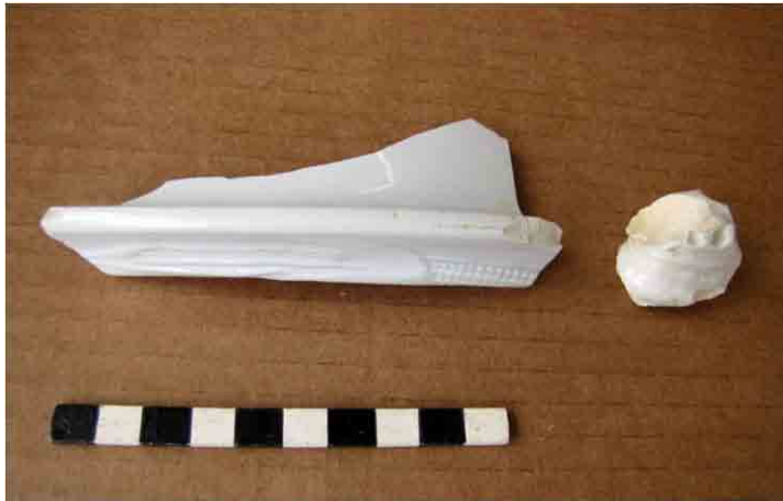
FIG. 46. Dos fragmentos de loza Pearlware de inicios del siglo XIX, únicos encontrados en el cañadón