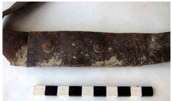
FIG. 87. Suncho fijado con remaches industriales de perfecta simetría