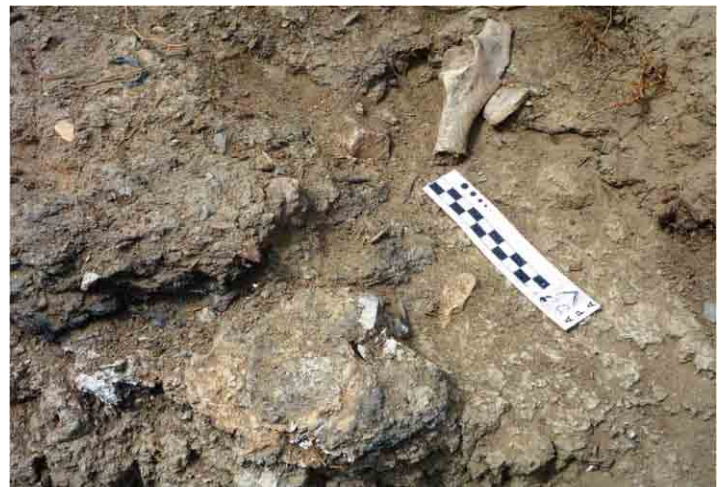
FIG. 31. Restos óseos dentro de la capa de carbón

movidos desde su sitio original. Las estructuras de más arriba así lo demuestran. En cuanto a esto, la presencia de clavos y vidrios muy modernos puestos en contexto con lo antiguo, lo hace muy factible aunque a vista macroscópica todo conforma un sedimento íntegro. Nuevamente los procesos taxonómicos locales deben ser analizados con mayor