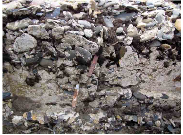
FIG. 8 y 9. Posibles restos de las obras frente a la costa hechos para la Subprefectura, hoy casi desaparecidos; nótese los extremos salientes de clavos de perfil cuadrado en los lugares con marcas de columnas de madera

ros, no hicieron construcción alguna salvo un mástil para una bandera. Tal como se describió el acontecimiento “no se quemó pólvora en la ceremonia ni las hubo especiales. El festejo único consistió en una copa de champagne ofrecido a borde del Los Andes, por su comandante” 14 .