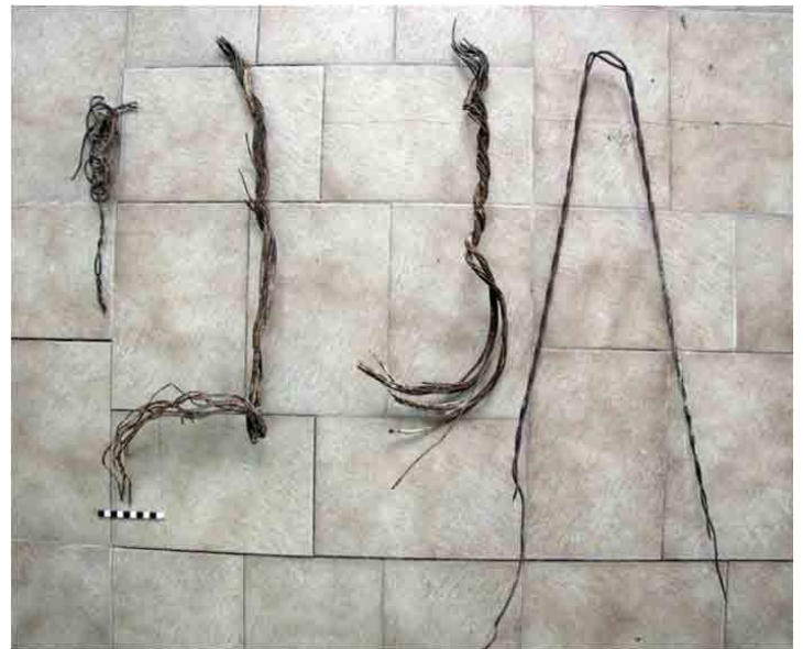
FIG. 95. Tensores para sostener las láminas anteriores y fijarlas con estacas al suelo