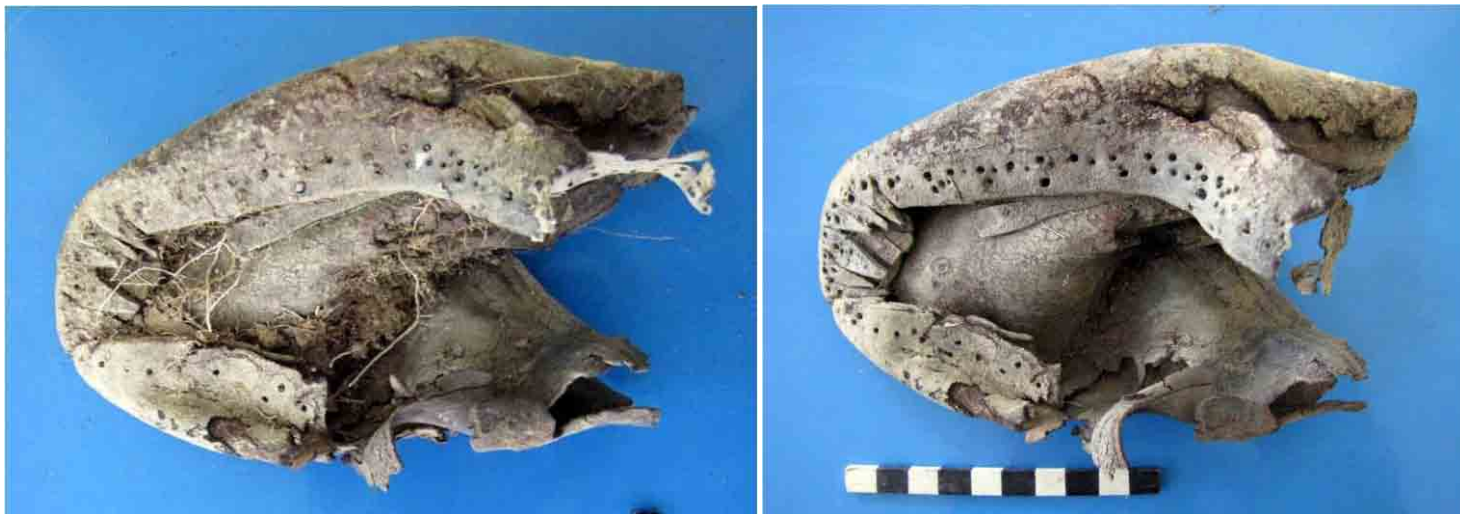
FIG. 68 y 69. Fragmento de calzado de cuero antes y después de su limpieza