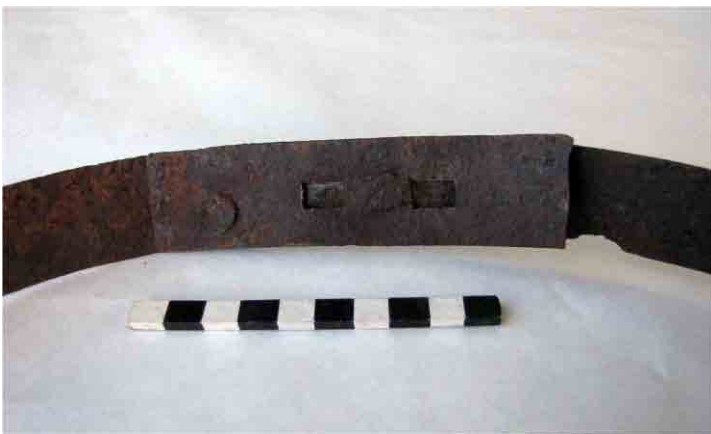
FIG. 83. Parte posterior de un engrampe para ajustar sunchos al barril, preparado para clavos de perfil rectangular, posiblemente de finales del siglo XIX, producto de las primeras industrias aunque usado con un remache circular posterior