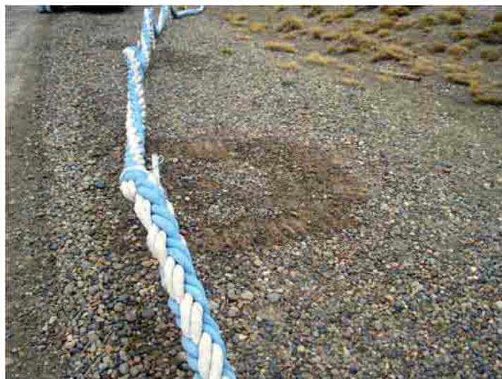
FIG. 2. (Izquierda) Entrada al cañadón: la carretera, el Lugar Histórico y sus monumentos, hacia el centro los arenales con restos de ocupación histórica, al fondo a la izquierda la casa de la familia Canal, bajo el cerro de la foto está el área que ocupó la fábrica Rouquaud en 1872. FIG. 3. (derecha) Estructura de ladrillos visible en 2008 y ubicada en el Lugar Histórico, el paso de vehículos producía su desgaste sistemático y ya había sido rebajada al hacerse el camino