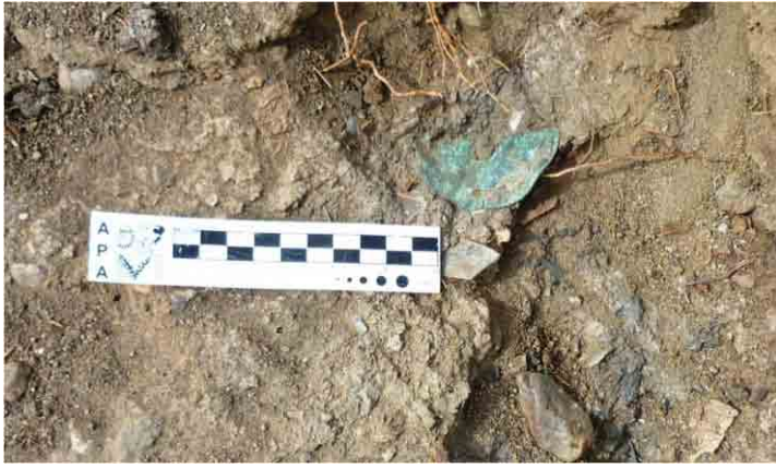
FIG. 32. Chapa circular de cobre durante su hallazgo