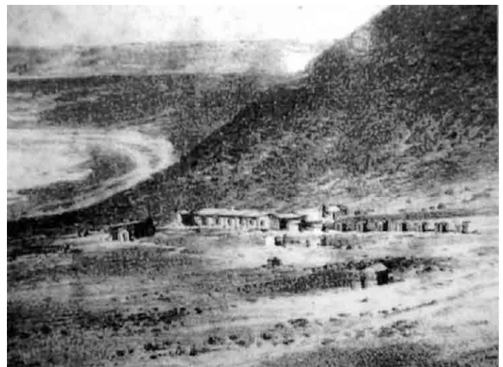
FIG. 7. La fábrica con todas sus construcciones anexas, seguramente hacia 1874. Nótese las pequeñas estructuras ubicadas al frente a la derecha y adelante al centro