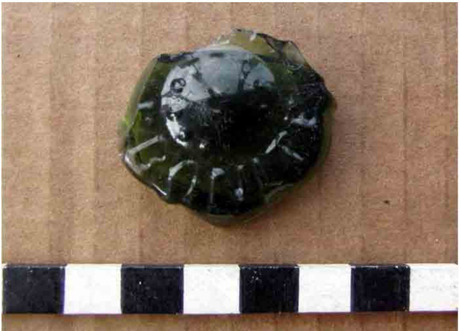
FIG. 56. Base de botella verde con la inscripción Ebonite, posiblemente de un tintero de inicios del siglo XX