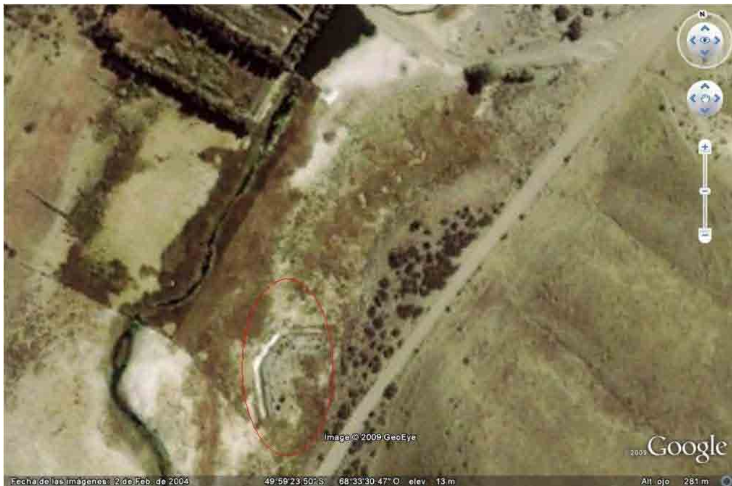
FIG. 39. Ubicación del área fortificada con trinchera excavada en la foto satelital