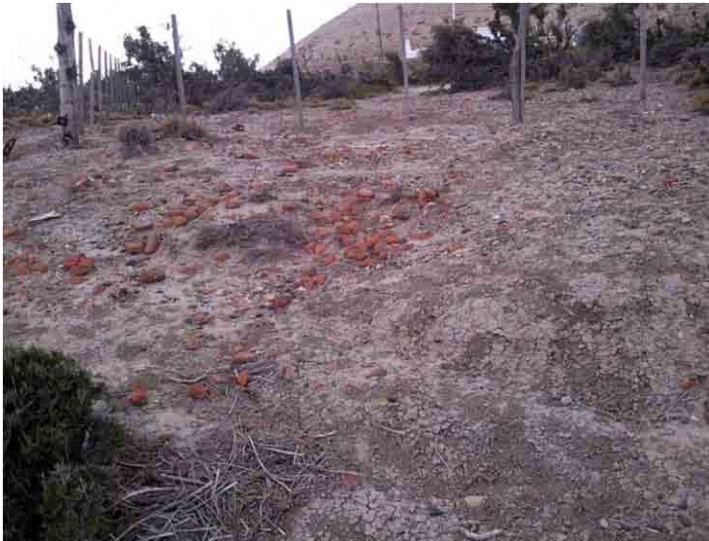
FIG. 13. Proceso de arrastre de la Estructura 2 hacia el arroyo por el agua de deshielo anual; se contaron más de cuatrocientos fragmentos de ladrillos dispersos en un área de 50m de lado