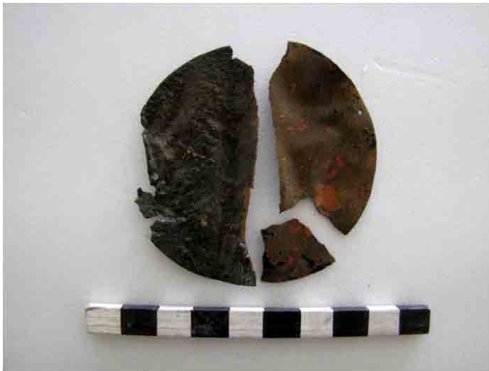
FIG. 33. Chapa de cobre limpia y consolidada; el agujero para colgar hace pensar en un ornamento indígena de tipo Mapuche