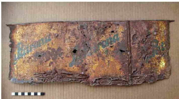
FIG. 59. Chapa estampada de aceite La Patrona, siglo XX, posiblemente usada para una pared