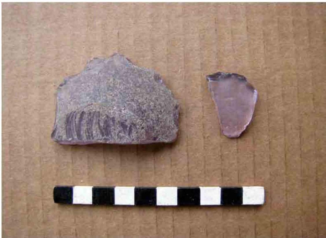
FIG. 53. Dos fragmentos de vidrio transparente que posiblemente fueron usados como instrumentos cortantes