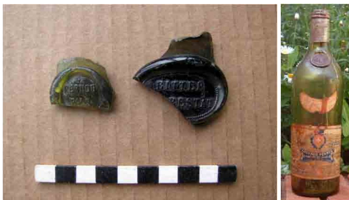
FIG. 19. Marcas de vidrio del hombro de dos botellas; a la derecha una de vino Pernod francés como ejemplo de su tipología. Nótese el pico, similar a gran parte de los encontrados

En un principio se supuso que era un pozo de letrina o fogón, pero ninguna de ambas hipótesis puede ser demos-