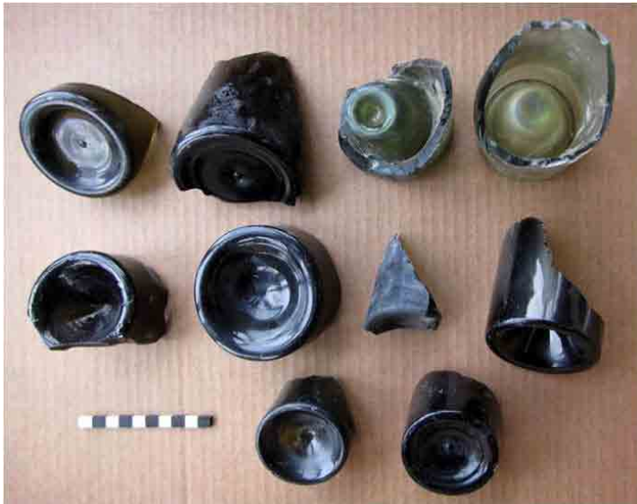
FIG. 57. Bases de botellas cilíndricas de la segunda mitad del siglo XIX, francesas las de arriba a la derecha y el resto posiblemente hechos en Inglaterra con moldes de calidad