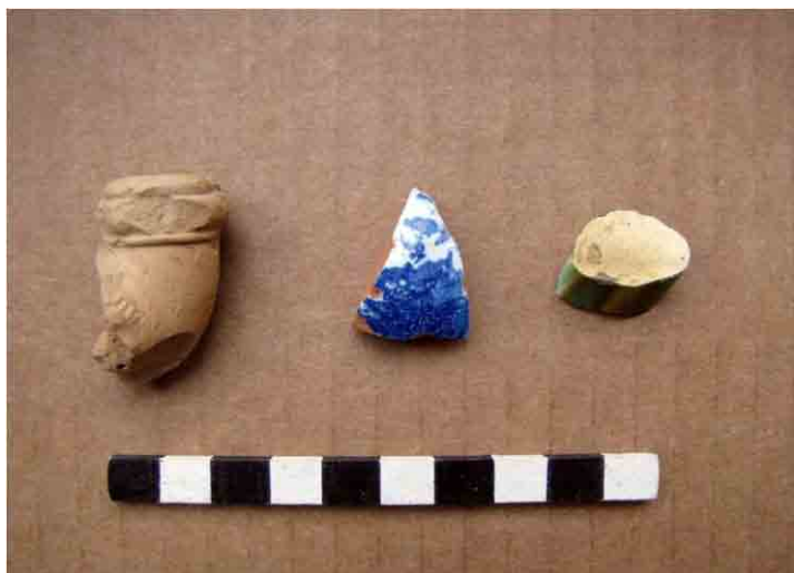
FIG. 47. Tres peculiares objetos de cerámica: una cazuela de pipa, una mayólica de la región andina y una cerámica vidriada inglesa tipo Doulton