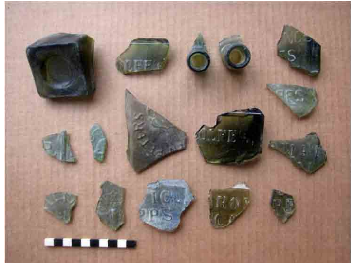
FIG. 60. Fragmentos de botellas de ginebra con inscripciones