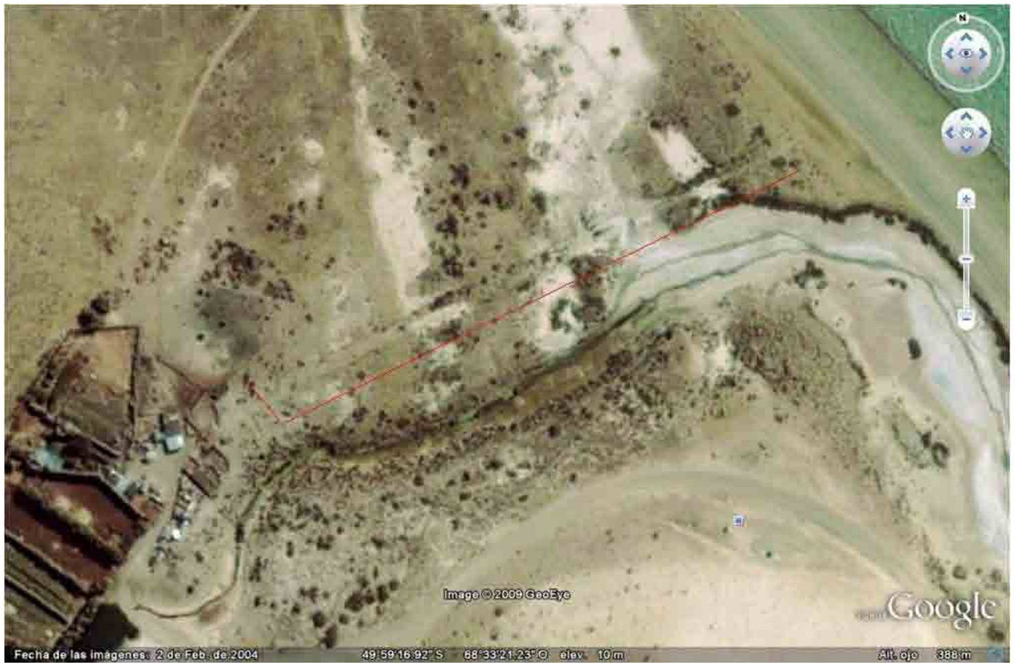
FIG. 41. Estructura en forma de canal que llega hasta la ría, el rojo remarca su trazado recto