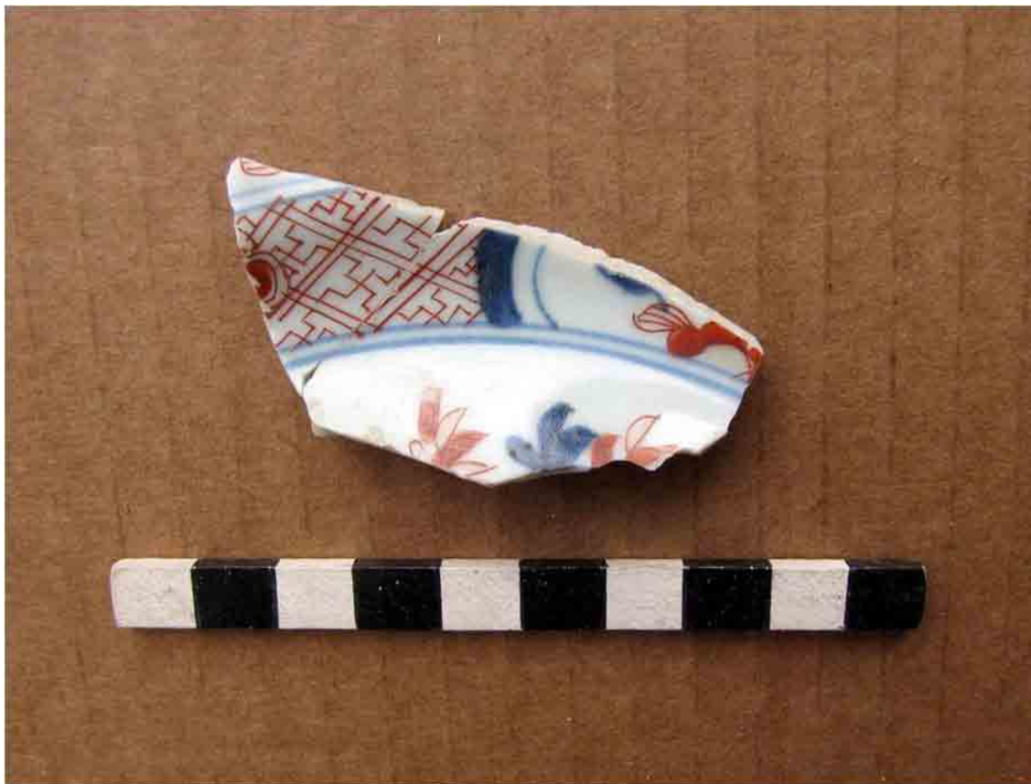
FIG. 52. Porcelana China de base celeste pintada a mano, siglo XIX temprano