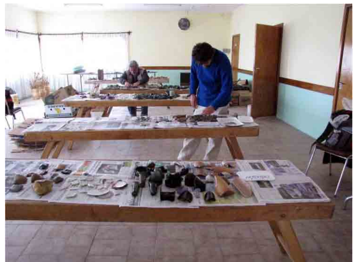
FIG. 67. Laboratorio de campaña ubicado en la Sociedad Rural de Puerto Santa Cruz

Se realizó la adhesión de fragmentos de vidrio y cerámica hallados en superficie. El adhesivo utilizado es reversible, es decir, que puede ser retirado en un futuro, si fuera necesario.