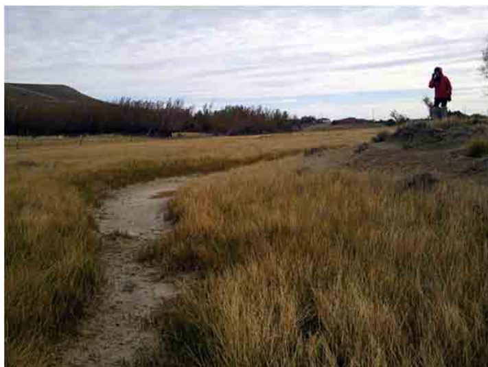
FIG. 40. Posible estructura fortificada mediante canal y empalizada de tierra

éstas sólo se ve la tierra inferior. No tenemos explicación para este fenómeno de formación del suelo. Incluso es posible que éstas hayan sido dejadas ex profeso si su uso fue el de canal de riego, aunque para mover productos és-