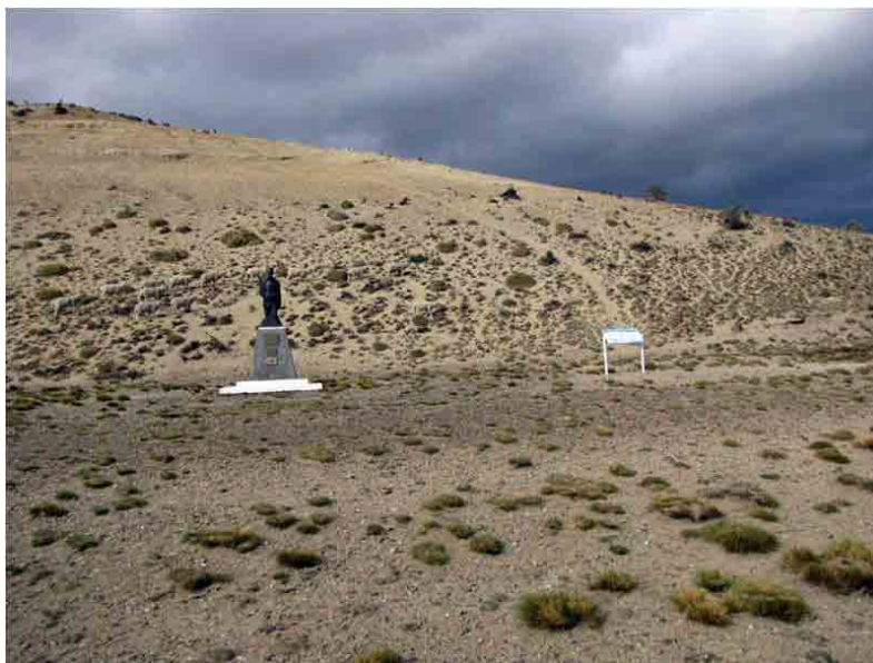
FIG. 24. Área del Lugar Histórico donde posiblemente se encontraban las construcciones de la fábrica de aceites