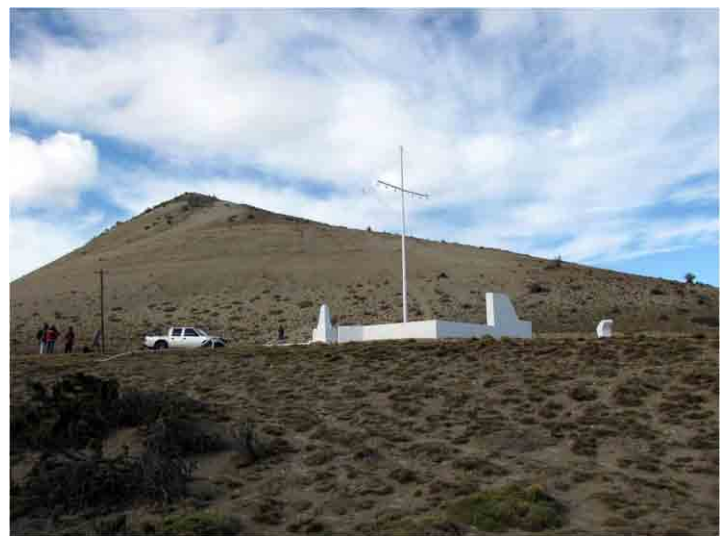
FIG. 6. Fotografía tomada desde el mismo punto de vista mostrando la terraza sobre la cual fue construida la fábrica, casi coincidente con la carretera actual