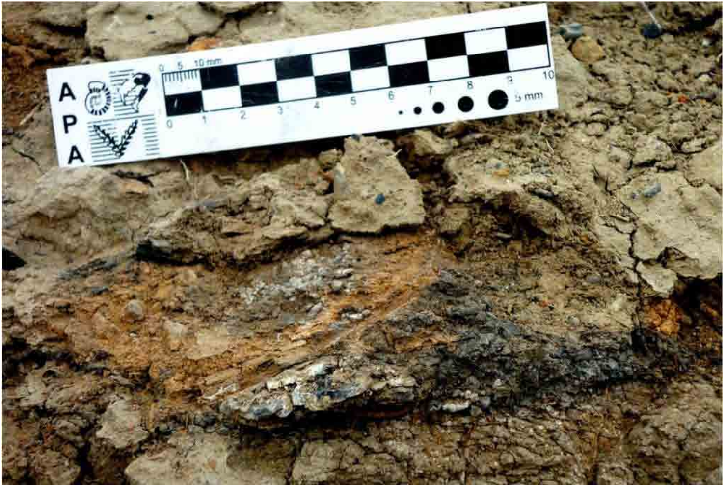
FIG. 29. Detalle tierra rubefaccionada y carbón