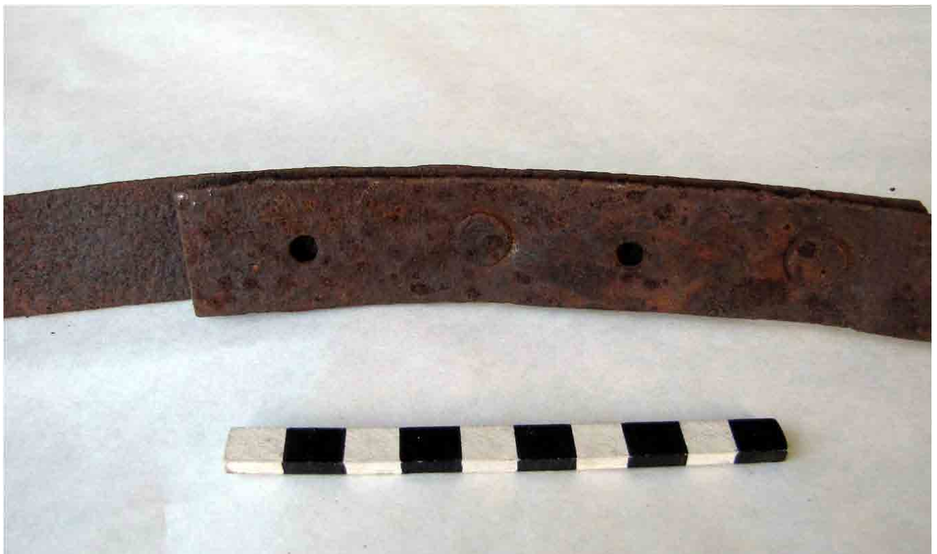
FIG. 89. Suncho ya preparado con tres agujeros para ajustarse a diferentes anchos de barril, que fue fijado con dos remaches circulares de máquina