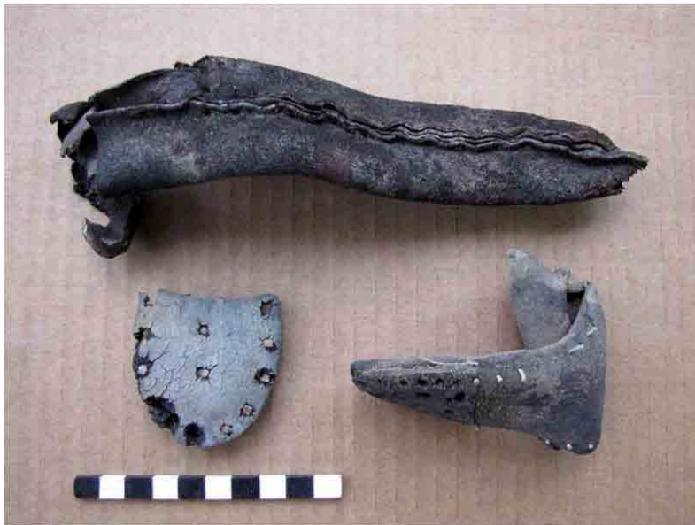
FIG. 23. Fragmentos de zapatos claveteados y cosidos con alambre de cobre, y vaina de cuchillo cosida a mano