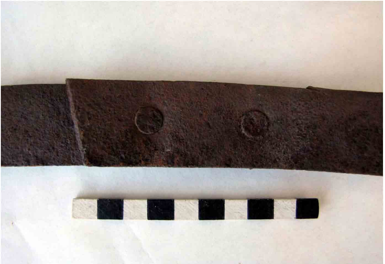
FIG. 92. Otro ejemplo producido en máquina, unido por dos remaches circulares con el borde cortado de manera irregular