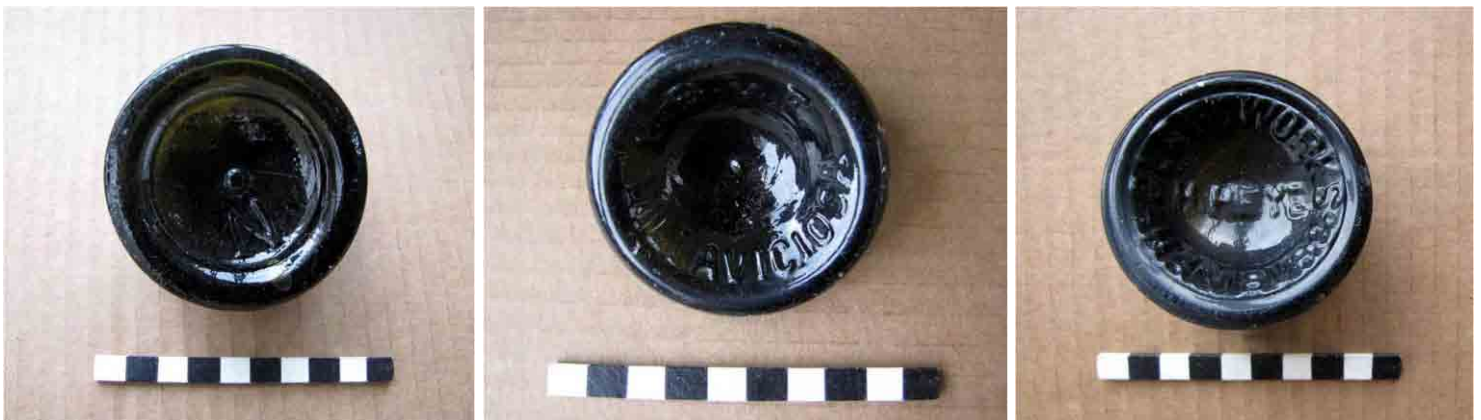
FIG. 37. Tres bases de botellas del sitio con sus marcas provenientes de Estados Unidos, España y Alemania

Es un pequeño sector en que fue retirada la piedra dejando la arena limpia en una superficie de unos diez metros cuadrados en los que se halló una alta concentración