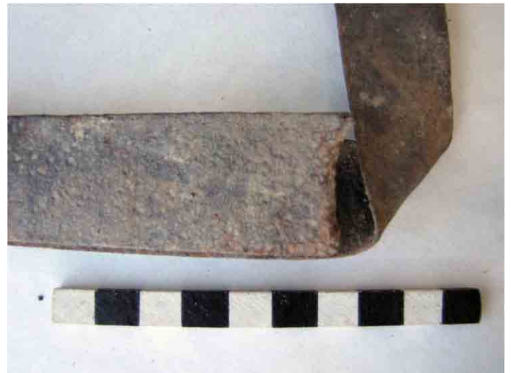
FIG. 86. Probable fleje cortado con maquinaria pero de terminación manual en el extremo; nótese la irregularidad al centro, antes del dobléz, contrastando con los bordes paralelos