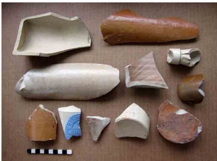
FIG. 48. Gres cerámico de cerveza, ginebra, tinta y agua mineral proveniente de diversas localidades de Europa, incluyendo una marca de Bieckert de la segunda mitad del siglo XIX