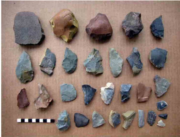
FIG. 66. Materiales prehistóricos recuperados en las transectas de recolección superficial del Arenal 1

Por observación de James Lewis, se ubicó el sitio de una posible inhumación humana, que de serlo podría no ser prehispánico sino histórico, cerca de las Estructuras 4 y 5, al pie de una pequeña barranca protegida de las inclemencias del tiempo; se informó de ello a los antropólogos de la región 21 quienes visitaron el sitio para tomar las decisiones que consideren al respecto.