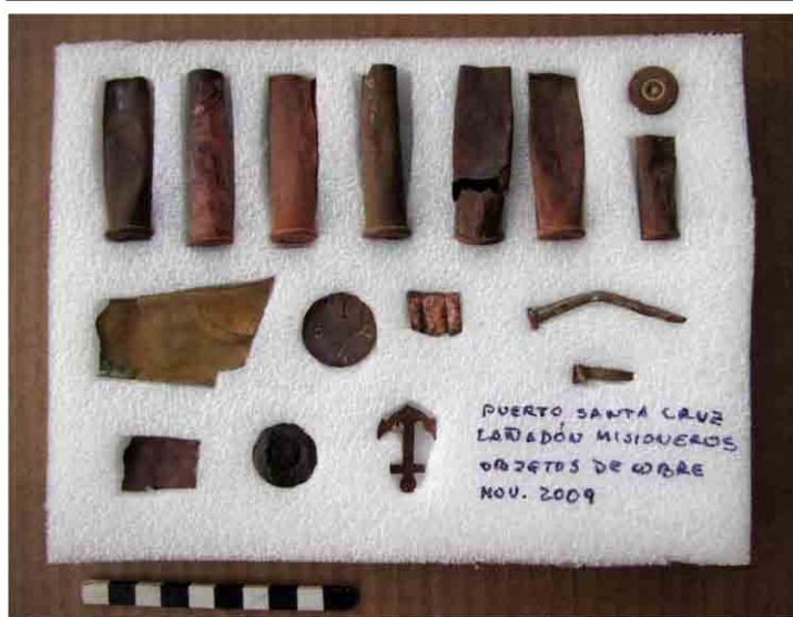
FIG. 71. Soporte de espuma de polietileno para objetos de cobre

contacto. Los materiales se agruparon por sector y se separaron de acuerdo a su materia prima. Las bolsas con su