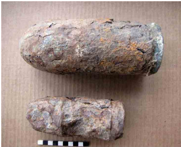
FIG. 16. Balas de cañón halladas por los vecinos en el cañadón

brica de aceite. Lo construido actualmente en el lugar, casi todo de 1978, es deplorable estéticamente y seguramente la profusión de placas de bronce y la imagen militar del sitio, actúe como un repulsor de turistas y no como un atractivo; pero ese es un tema que deberá ser evaluado por la localidad. El conjunto es una alegoría gloriosa a lo militar más que un recordatorio de la memoria, por eso resulta interesante la nueva propuesta de hacer en el lugar un sitio histórico recreativo.