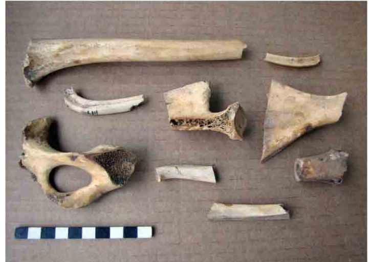
FIG. 22. Conjunto de huesos de mamífero con huellas de corte mecánico y marcas de cuchillo de la Estructura 1

El área de dispersión de ladrillos y materiales aquí fue de 23 metros de largo y se encontró gres, vidrio verde, negro y transparente, loza predominantemente blanca, metal (fragmentos de flejes) y dos cartuchos de balas. Hacia el extremo Este, casi al pie del monumento a Don Bosco, se recuperó un conjunto de cueros compuesto por dos restos de calzado (posiblemente botas) y una vaina de cuchillo o facón; al limpiar la superficie y profundizar para