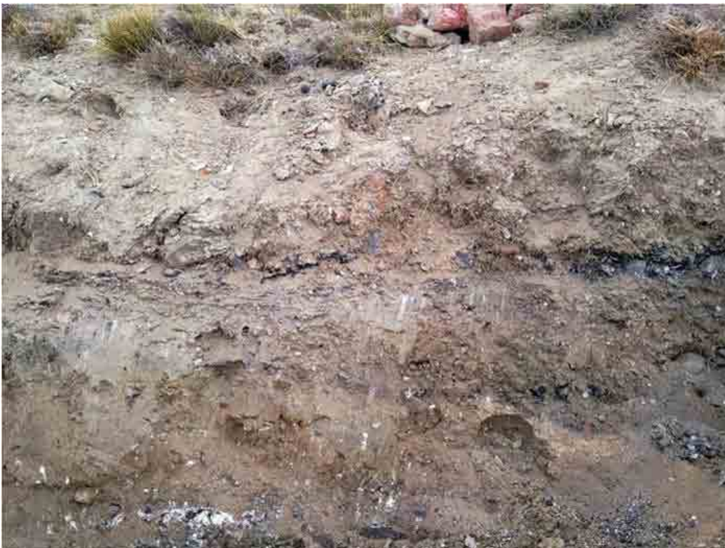
FIG. 18. Terraza donde estuvo la fábrica; lente de carbón cubierta por sedimento en la barranca cortada por la maquinaria vial. Arriba aun se ven ladrillos dispersos a punto de caer