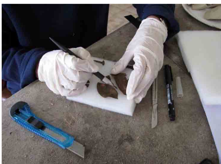
FIG. 70. Soporte para los objetos de cobre