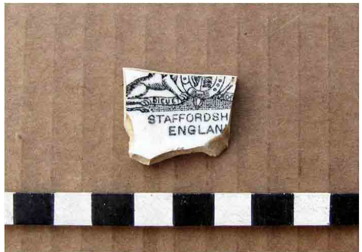
FIG. 49. Marca de loza proveniente de Staffordshire con las armas reales, por lo que es casi imposible identificar al fabricante: la palabra England indica que puede ubicarse entre 1891 y 1900