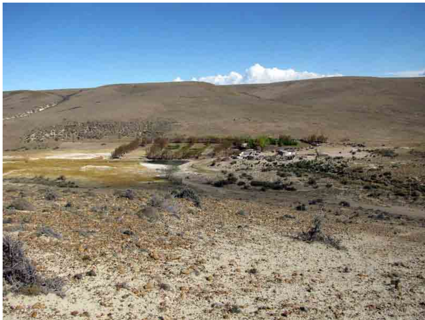
FIG. 4. Vista del interior del cañadón: la casa Canal en su centro, sus plantaciones y arboledas, que posiblemente cubran el área de ocupación más tardía del siglo XIX, el arroyo y el dique que lo encauza