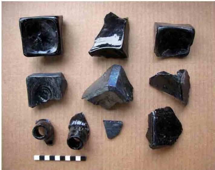
FIG. 58. Bases de botellas cuadradas para ginebra, posiblemente provenientes de Holanda, de finales del siglo XIX