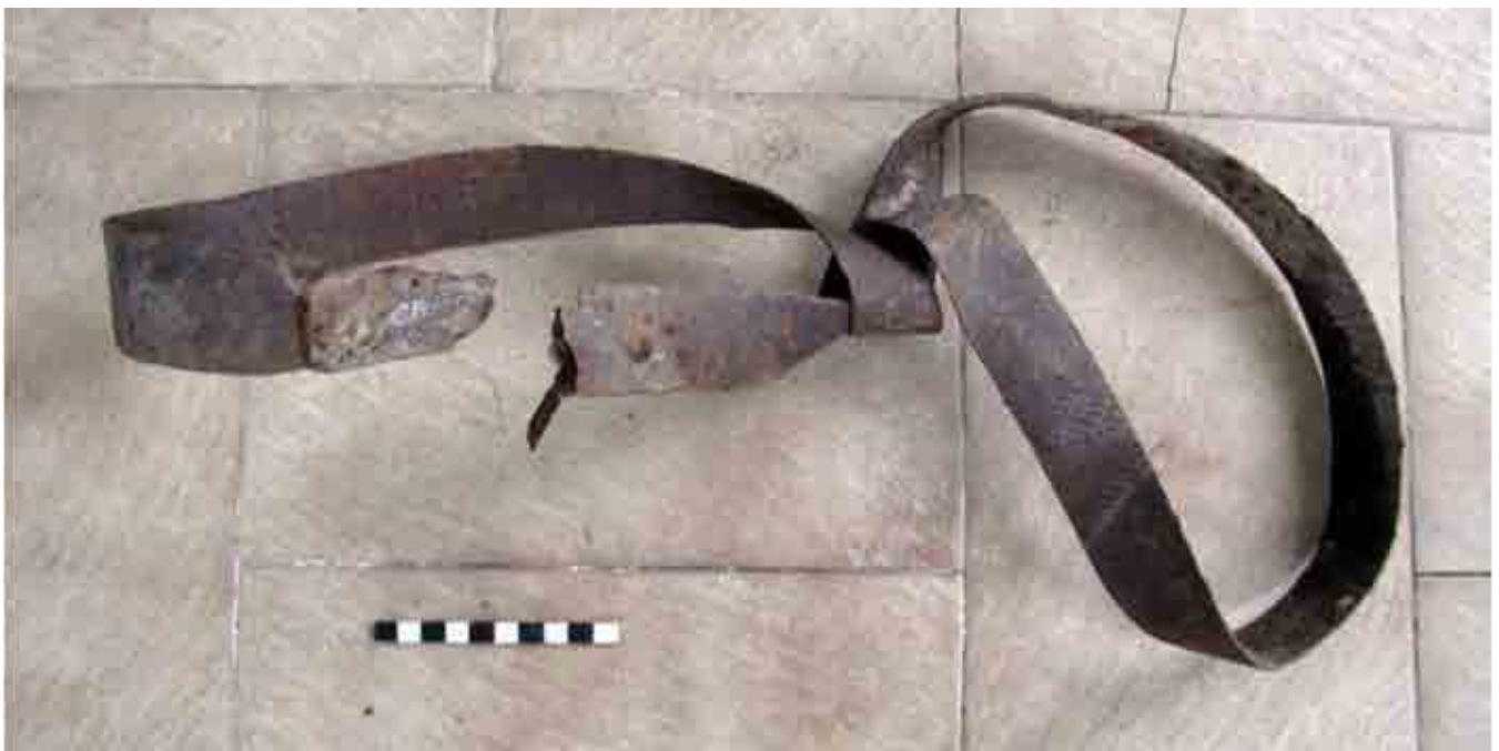
FIG. 93. Suncho de barril en perfecto estado que fue enroscado antes de su descarte por la posible rotura, índice de la baja reutilización del material