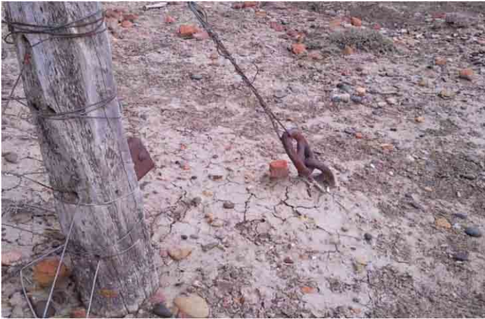
FIG. 15. Eslabones de una cadena de la mitad del siglo XIX, seguramente de un ancla, usados para sostener alambrados modernos