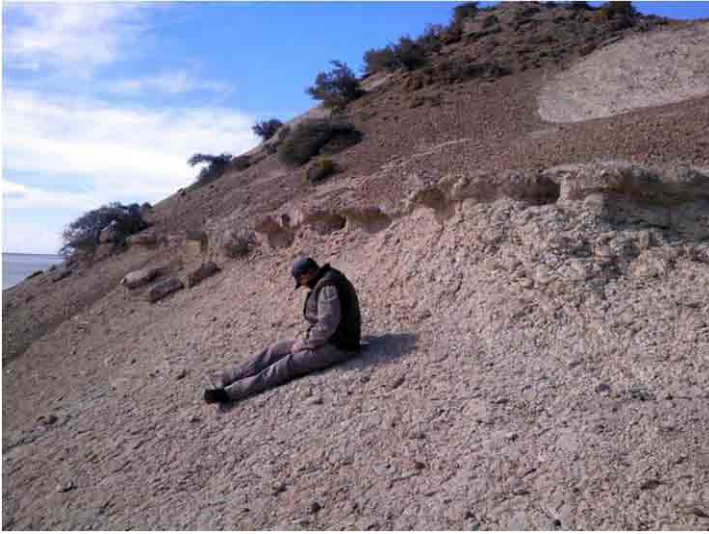
FIG. 12. Parte superior del cerro existente sobre el Lugar Histórico mostrando el antiguo nivel del lecho marino, cuyo constante derrumbe produjo el sedimento que cubre parcialmente las estructuras antiguas