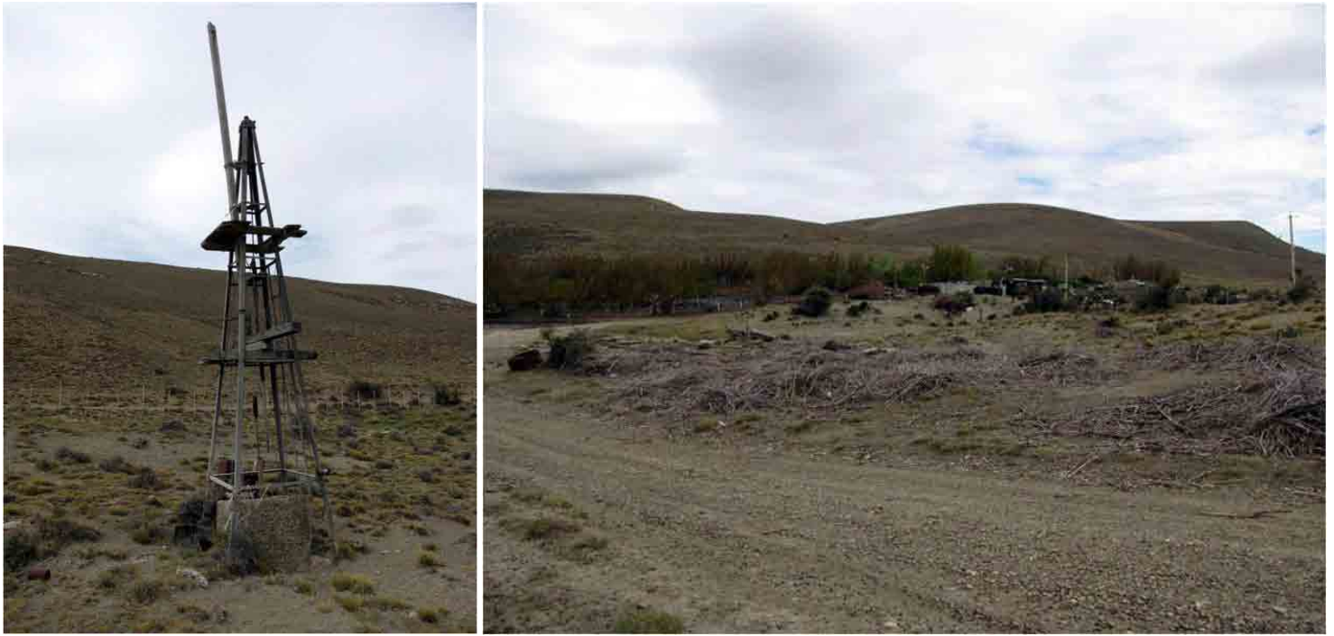
FIG. 42 y 43. Dos vistas de los terrenos de la familia Canal, donde posiblemente haya habido asentamientos pero que no ha podido ser estudiado en detalle

maderas empotradas de corte cuadrado, de lo que quedan las marcas, pero ha sido imposible identificarlo. Por su parte, lo asociamos con las obras de la Subprefectura.