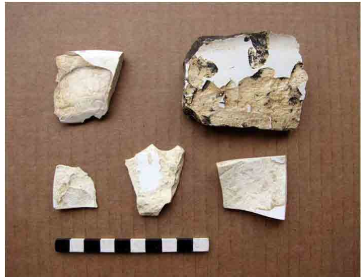
FIG. 10. Fragmentos de lozas altamente deteriorados por la exposición a la intemperie, que produjo la destrucción del esmalte y el lascado al moverse entre piedras

La playa, con sus constantes mareas de varios metros, hace imposible la persistencia de cualquier tipo de estructura o relicto de uso humano.