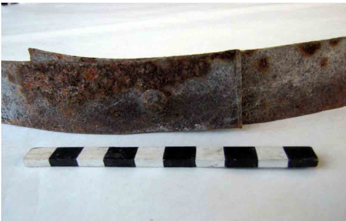
FIG. 91. Fleje de máquina con un remache de unión, cuyo borde final está cortado a mano