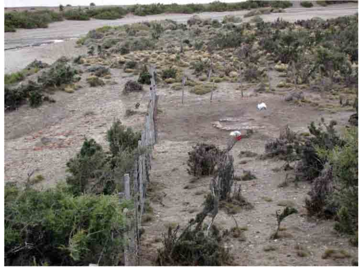
FIG. 25. Vista general: la Estructura 2 al centro y el fogón ubicado en el ángulo del alambrado; la foto está tomada desde la elevación de la Estructura 3, al fondo el arroyo

En la barranca que va desde el Lugar Histórico hacia el arroyo, es decir dirigiéndose hacia el norte, hay un área que al parecer ha sido poco perturbada y crecen arbustos de ciertas dimensiones indicando ocupación anterior. Creemos que es otra construcción auxiliar de la fábrica de