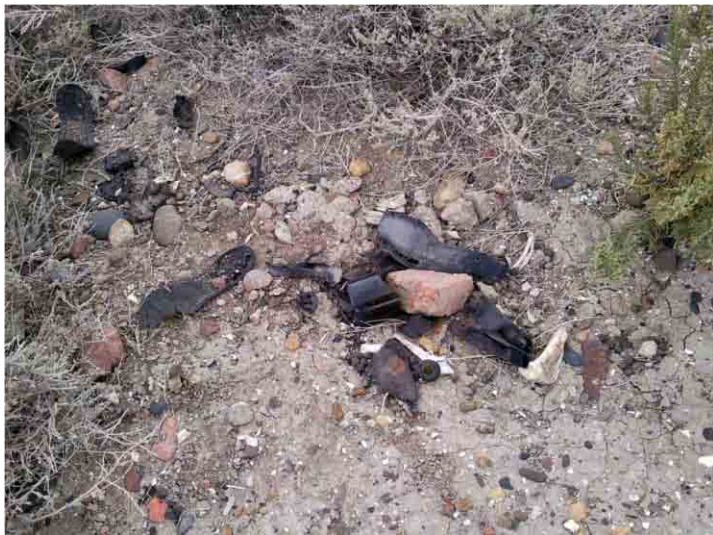
FIG. 38. Concentración de suelas de zapatos y botellas de ginebra holandesa en El Arenal 2

de objetos: once suelas de zapatos, dos fragmentos de gres de cerveza, once fragmentos de gres de ginebra, 32 fragmentos de vino negro y una única loza blanca. Está ubicado a mitad de camino entre la bajada del monumento que lleva a las Estructuras 3, 4 y el llamado El Arenal 1, a unos quince metros del arroyo actual hacia el norte. El material se describe incluido en el del cañadón en forma general. Consideramos que este sitio es ligeramente anterior a los demás de la zona, aunque resulta imposible saber con certeza la diferencia temporal, dado que históricamente los eventos sucedidos lo fueron con muy pequeñas diferencias de tiempo; pero por los materiales ausentes puede que sea posible ubicarlo más cerca de 1870 que de 1890, en términos generales.