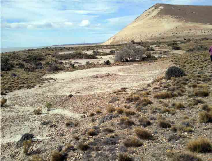
FIG. 35. Área descubierta de piedras de forma alargada este-oeste, frente al mar, con evidencias de ocupación militar a finales del siglo XIX

mínimo de individuos, NMI) calculando las bases y picos. Cabe destacar que la mayoría de vidrios son negros y de tradición inglesa, para vinos y licores, casi no habiendo ginebras cuadradas. Otro elemento curioso resultó ser la marcada cantidad de botellas de sidra con la marca ( N ) V. B. y F. provenientes de Villaviciosa, en Asturias, España, primera vez que las encontramos en el país. Estas están junto a varias bases de H. Heye Glassworks de Hamburgo, fábrica que funcionara entre 1880 y 1890, y otras con una N en la base, posiblemente de la fábrica Obear-Nester Glass Company , de East Saint Louis, Illinois, Estados Unidos, que comenzó a trabajar en 1894, mostrando que la variedad temporal del material dentro de la misma categoría no es poca. Hay muchos picos de amargos tipo bitter e incluso vino Chianti. Pero la marca N nos