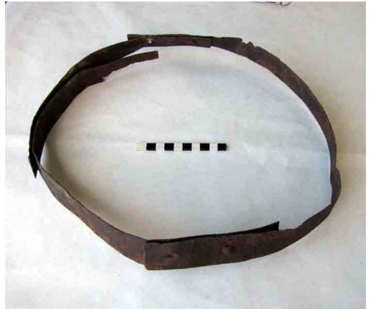
FIG. 85. Fleje completo de tipo industrial, arreglado con tres fragmentos para adaptarse y seguir en uso