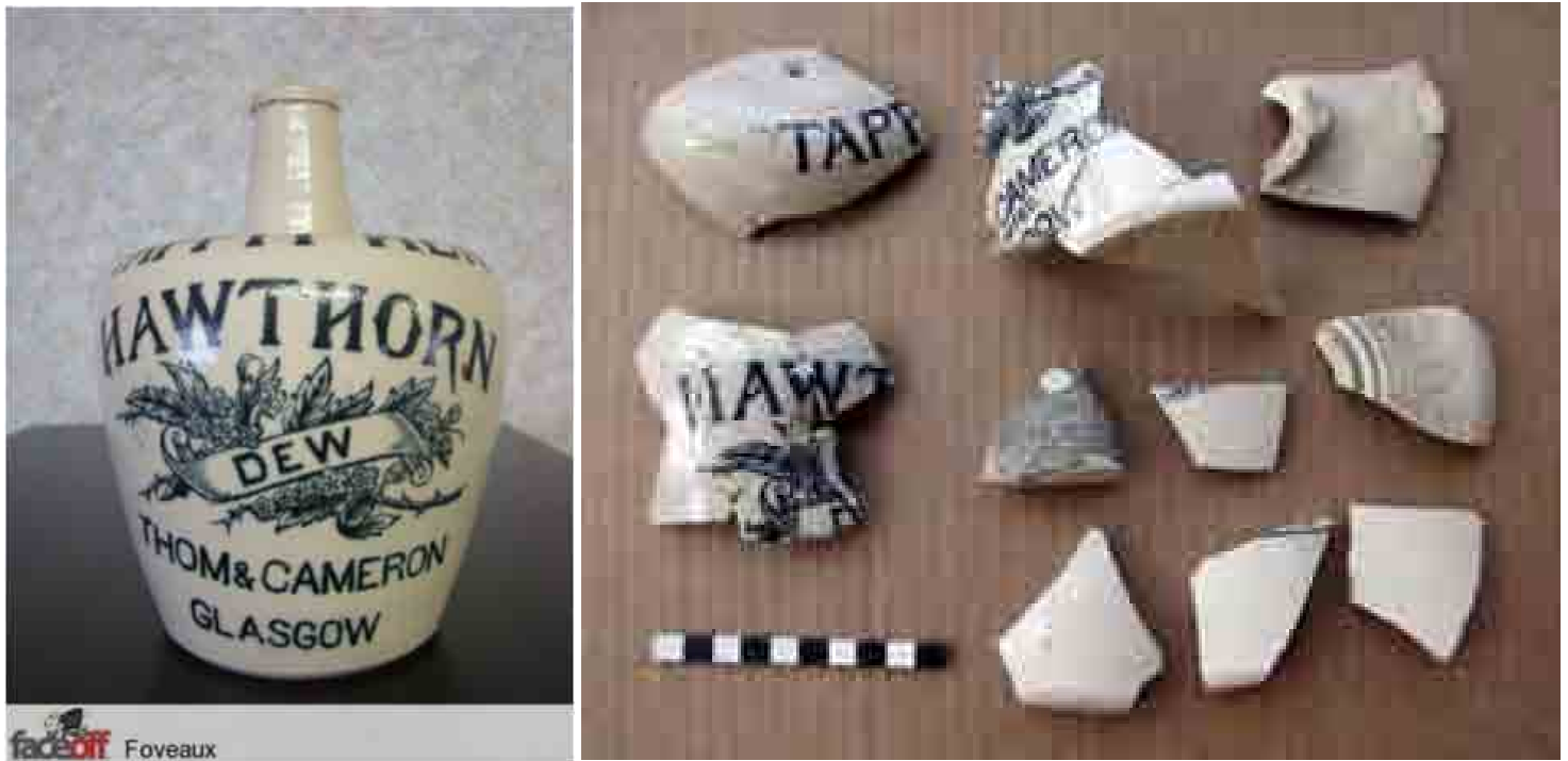
FIG. 44 y 45. Fragmentos de un botellón de gres para whiskey proveniente de Inglaterra, fabricado en la década de 1880, como el ejemplar de la izquierda

colgante metálico, típico de la ornamentación personal de los Mapuche como aros, bien puede ser del siglo XIX o incluso del XX como se ve en las múltiples fotografías existentes. Por supuesto abre un interrogante sobre su presencia en el sitio.