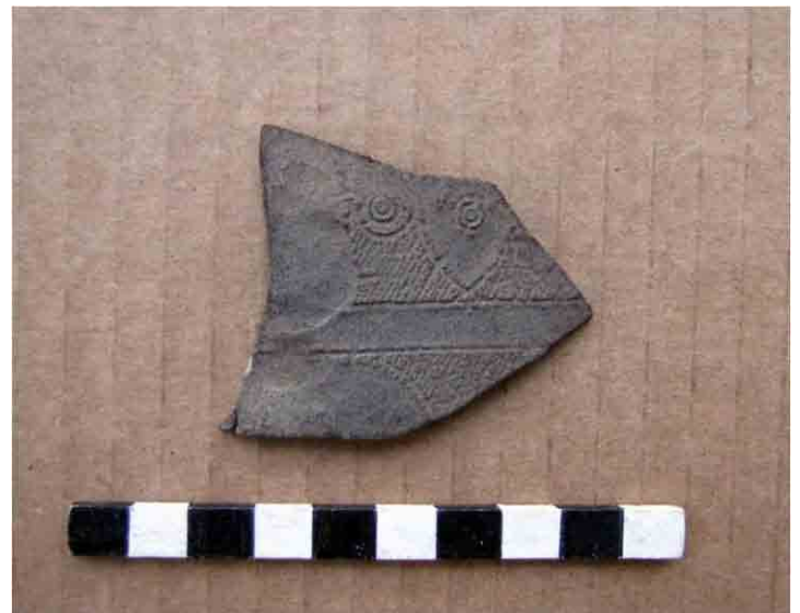
FIG. 65. Fragmento de cuero finamente estampado, que fue cortado para otro uso y luego descartado

El otro tema presente en todo momento es que el cerro ubicado encima de Lugar Histórico es un yacimiento fosilífero de enormes dimensiones: en la parte superior hay una cubierta de sal marina y en todo el cerro hay fósiles