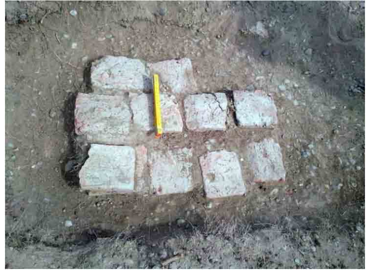
FIG. 27 y 28. Estructura 4: acumulación visible en el sitio y luego de haber sido limpiada, mostrando los restos de un piso irregular y con medios ladrillos

Los materiales culturales encontrados son: cinco vidrios negros, uno transparente y dos fragmentos de metal entre el interior y una superficie de un metro a la redonda de la estructura.