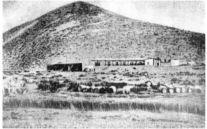
FIG. 5. Vista de la fábrica de aceites de Rouquaud, posiblemente hacia 1872; nótese los barriles en la parte inferior

“casa principal, casillas, galpón, industrial, depósito de víveres y materiales; fueron situados a unos cien metros de la