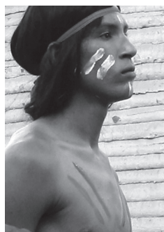
Joven con fenotipo taíno, Baní. 6