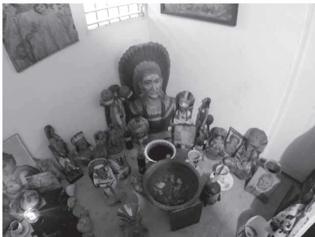
Altar de Agua Dulce en la 21 División.

Por otro lado, un aspecto importante de la 21 División es que las iconografías indias nunca se colocan en los altares, sino que optan por colocarse en el suelo, acompañadas de un recipiente con agua y lejos de cualquier influencia católica o africana. Sin embargo, la razón de esto no está clara.