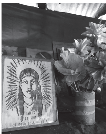
Anacaona en el Altar del Calvario de Liborio Mateo.

se llama “Agua Dulce”. Pero fuera de ello son dos manifestaciones religiosas muy diferentes. Los liboristas, por ejemplo, se apoyan fuertemente en el catolicismo y lo taíno. El componente taíno en los liboristas consiste en rendir homenaje y ofrecer reconocimiento a los antiguos caciques (jefes taínos) de la isla. De hecho, esto es culto a los antepasados. Los liboristas consideran que los caciques taínos son santos y colocan sus iconografías en los altares, junto a la de los católicos y africanos.