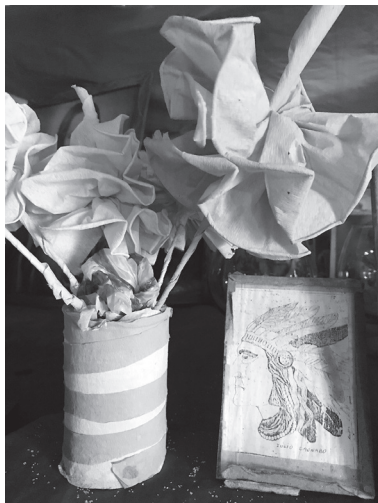
Caonabo en el Calvario de Liborio Mateo.