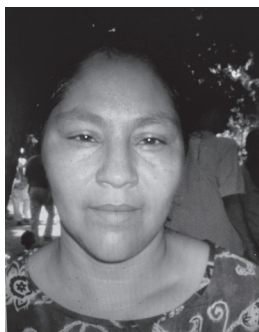
Mujer con fenotipo taíno, Baní