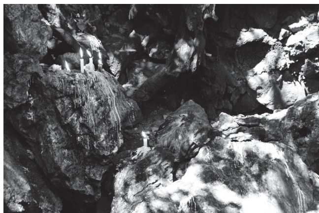
Luces en la pequeña cueva de “La agüita de Liborio”, donde se encuentra Anacaona convertida en jaiba.

Se dice que el agua opera como un vehículo para los espíritus. Por ejemplo, el agua puede usarse para sacar a los espíritus malignos que ingresan en una casa. Igualmente, se le puede hablar. El agua también se usa para bendiciones y protección. En Maguana hay personas que se especializan en “amarrar” la lluvia, un trabajo que generalmente realizan los curanderos. Hay mujeres que le cantan a la sequía para que llueva. Por lo general, son mujeres y deben de entrenar a 3 más. Los arawakos de Guyana creen que los espíritus del agua se les manifiestan a los humanos en forma de cotorras y cangrejos. ¡En Maguana, la gente cree que la cacica (jefa) Anacaona, una figura histórica, es un espíritu de agua, que aparece a los residentes y también en “La agüita de Liborio” en forma de Jaiba (cangrejo)!