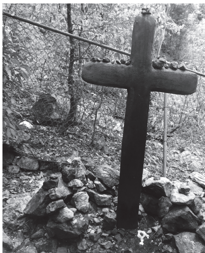
Ofrendas de piedra, Calvario de Liborio Mateo.

También se usan las piedras para adivinar y para ayudar a los cultivos a crecer, como es el caso de la continuación de la tradición del cemí Yucahu, espíritu de la yuca, en un campo de Azua. Igualmente existen las piedras comunales donde aldeas o comunidades enteras las veneran, las alimentan, les riegan agua, café y les rezan.