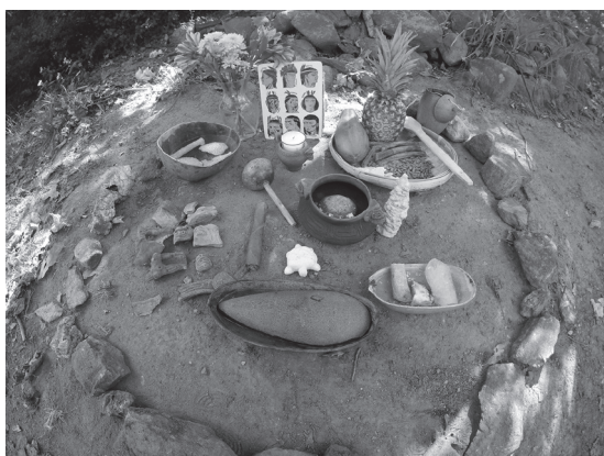
Itar Taimaní.

VIDEO Huellas del agua dulce https://youtu.be/JfEOXqGtv9w