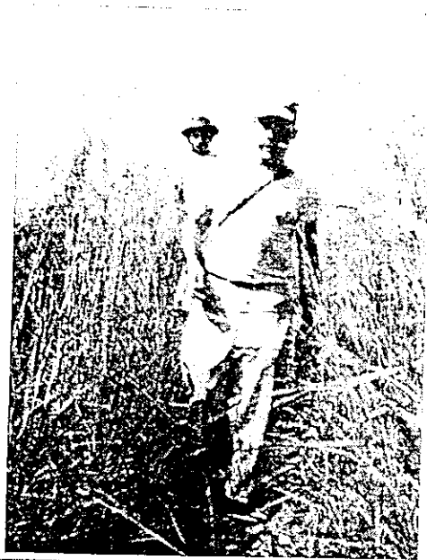
Členové expedice procházejí nekonečné trávové porosty náhorních planin. (Prvý jde prof. Rivero.) Tráva tu někdy dosahuje výšky člověka.