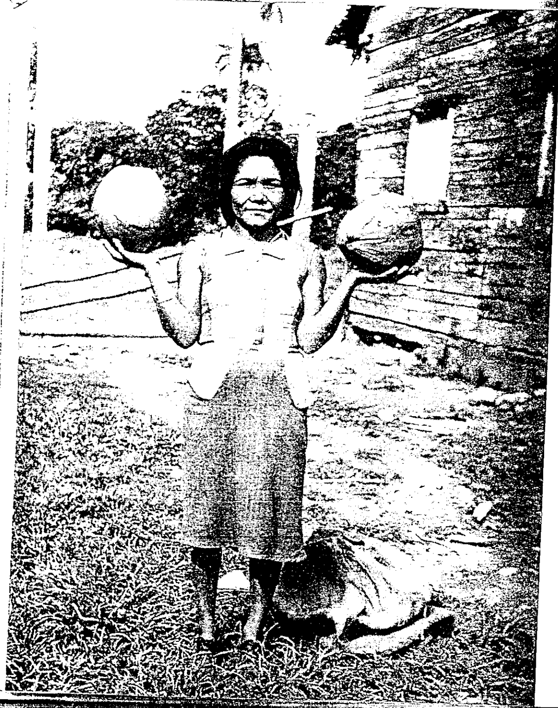
Důležitým doplňkem chudícké potravy yateraských Indiánů jsou kokosové ořechy.