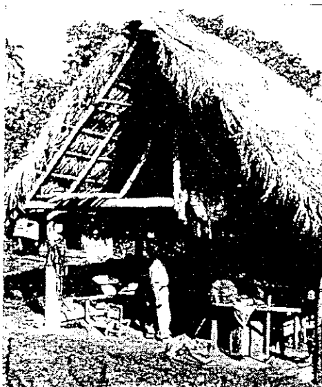
V San Andresu byla přechodným domovem expedice tato indiánská chýše.