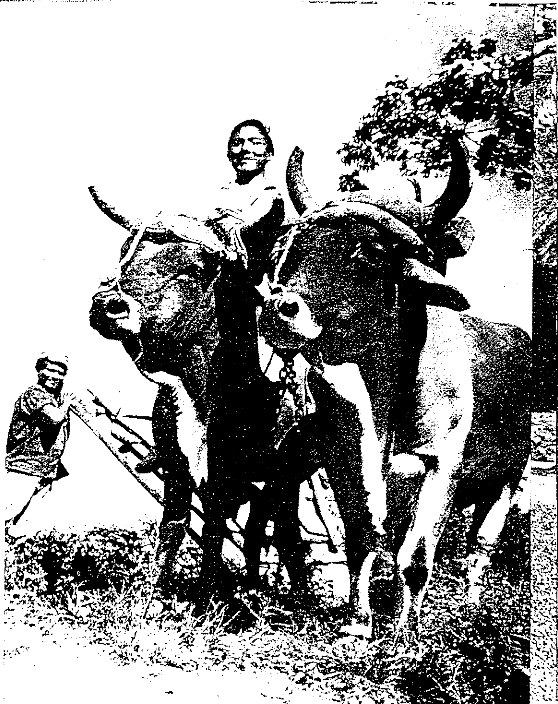
Uneš, tak jako v předkolombovských dobách, jsou kubáňští Indiáni převážně zemědělci. Na obrázku zajímavý vlek používaný v Iscondidě.